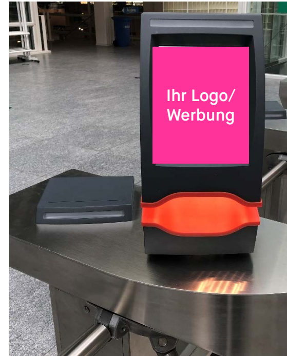
Anzeige Ihrer Werbung auf dem Zutritts-Display (Beispiel)

Grafik: max. 800x600 Pixel Format: PNG, JPG oder GIF Grösse: max. 60KB Lieferung an: ticketing@messe.ch