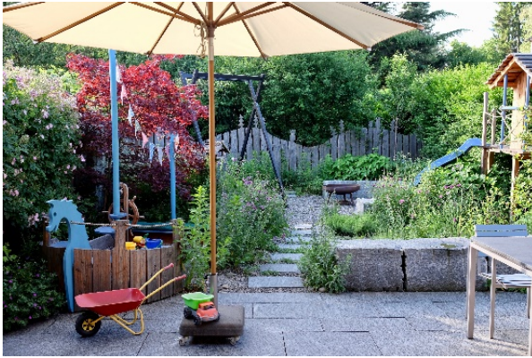
Spiel und Spass für die Kleinen stets im Blickfeld der Grossen. Bild: Winkler Richard Naturgärten ( Download )