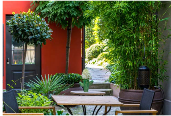
Ein kleiner verwunschener Vorgarten grosszügig inszeniert. Bild: Berger Gartenbau ( Download )