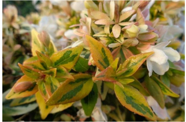
'Kaleidoscope' bringt schönen Blattschmuck und weisse Blüten in den Garten