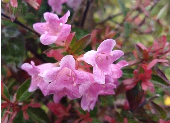
Abelia 'Edward Goucher' besticht durch lila-violette